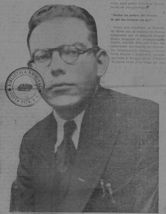
Camarada MANUEL MORA V.